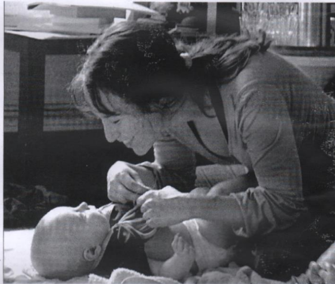
Le contact charnel renforce le lien d'attachement et a des répercussions bénéfiques sur la santé. o.a.

Il y a également des bénéfices sanitaires. « C'est un moyen de renforcer le système immunitaire, d'améliorer le sommeil, de stimuler les organes vitaux et la peau. Des études scientifiques ont prouvé que